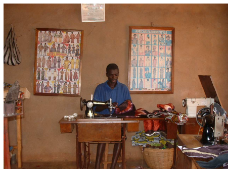
L'atelier d'un couturier

Pino emmène son cousin saluer son père. Quel est le métier de ce dernier ?